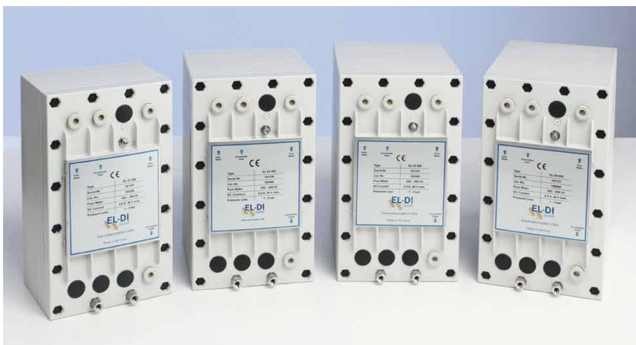
Die Zellen der M-Serie: EL-DI 250, EL-DI 400, EL-DI 500 und EL-DI 600.

** Maximale Produktwasserleistung bei 3 bar Druckverlust, +/- 5 %