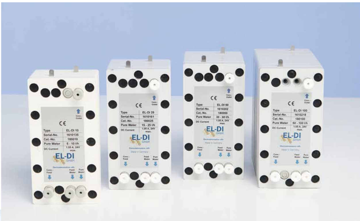
Die Zellen der S-Serie: EL-DI 10, EL-DI 25, EL-DI 50 und EL-DI 100.

Das abgebildete Fließschema mit RO und EL-DI-Zelle zeigt nur eine Möglichkeit der Einbindung. Es soll zeigen, wie einfach die EL-DI-Zellen zu integrieren sind.